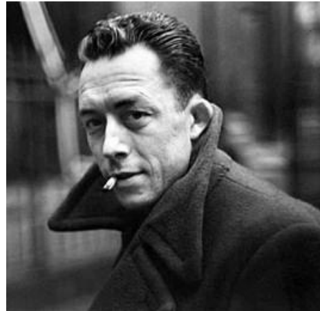
L'Étranger par Albert Camus

Salut et bienvenue à la classe d' IB Français Year 2 !