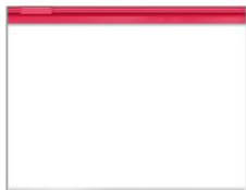
One-gallon clear, plastic freezer bag