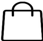
Bag that is clear plastic, vinyl or PVC