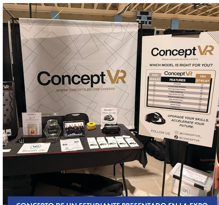
CONCEPTO DE UN ESTUDIANTE PRESENTADO EN LA EXPO

Además, ambas empresas se ubicaron en el percentil más alto a nivel nacional en el Concurso de Presentación de Negocios. Concept VR fue reconocida como una de las 50 mejores empresas de la Región Noreste en el Concurso de Planes de Negocios, y los estudiantes participaron en diversas ferias comerciales donde perfeccionaron sus habilidades de ventas y networking. El programa continúa brindando a los estudiantes experiencia práctica esencial, fortaleciendo sus capacidades de liderazgo, confianza y habilidades de comunicación profesional, preparándolos así para la universidad y sus futuras carreras.