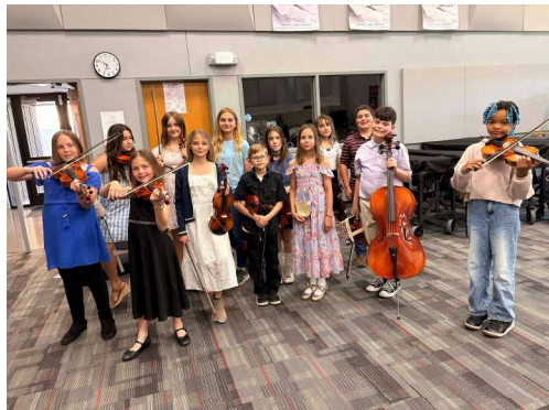
Concierto de cuerdas 27 de abril