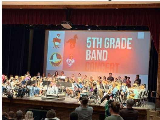
Concierto de banda 28 de abril