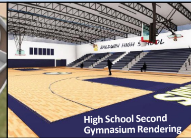
High School Second Gymnasium Rendering