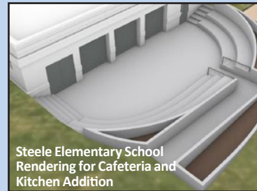
Steele Elementary School Rendering for Cafeteria and Kitchen Addition

We are excited to see these facility upgrades and bond projects underway this year as we continue building a future-focused campus for our students. These projects are strategically planned to minimize disruption to instruction, maximize state aid, and ensure the long-term sustainability of district facilities.