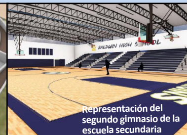
Representación del segundo gimnasio de la escuela secundaria