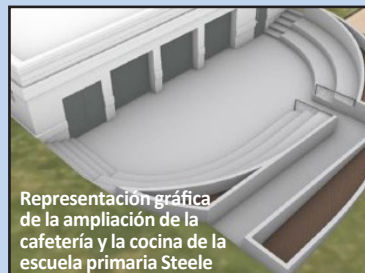
Representación gráfica de la ampliación de la cafetería y la cocina de la escuela primaria Steele

Estamos entusiasmados de ver que estas mejoras en las instalaciones y proyectos de bonos están en marcha este año mientras seguimos construyendo un campus orientado al futuro para nuestros estudiantes. Estos proyectos están planificados estratégicamente para minimizar las interrupciones en la enseñanza, maximizar la ayuda estatal y garantizar la sostenibilidad a largo plazo de las instalaciones del distrito.