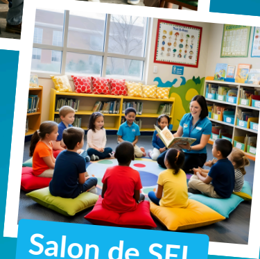
Salon de SEL