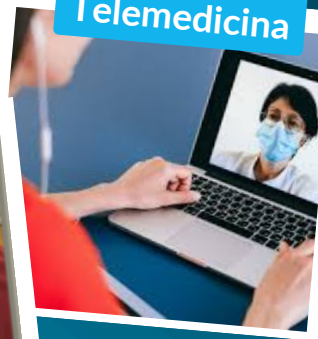
Servicios de Telemedicina