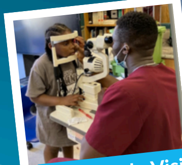
Eventos de Visión