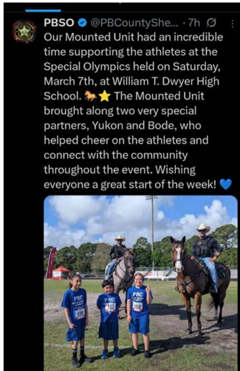
El equipo Howard con la policía montada de condado Palm Beach