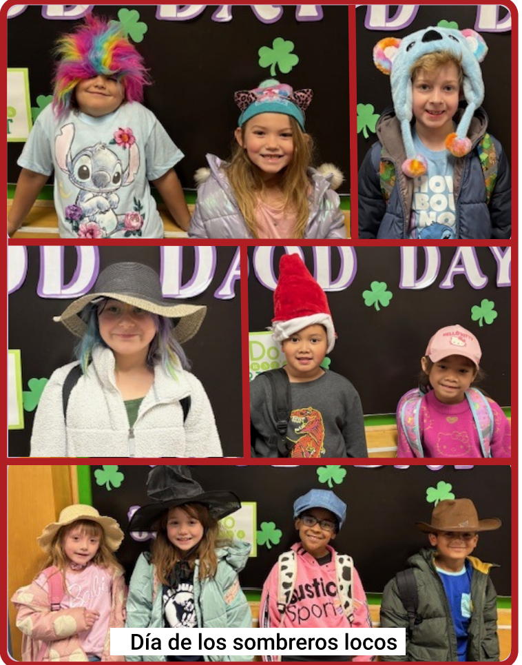
Día de los sombreros locos

Reflexionen, piensen y conversen sobre aquellas cosas que les gustaría hacer, pero que les resultan intimidantes o les dan miedo (ya sea de forma individual o en familia). Tal vez se trate de un nuevo pasatiempo, probar un juego nuevo, compartir su arte o algún invento con los demás, o emprender una aventura en algún lugar. ¡Anímense a intentar una de estas cosas juntos este mes y tómense una "selfie" para inmortalizar el recuerdo!