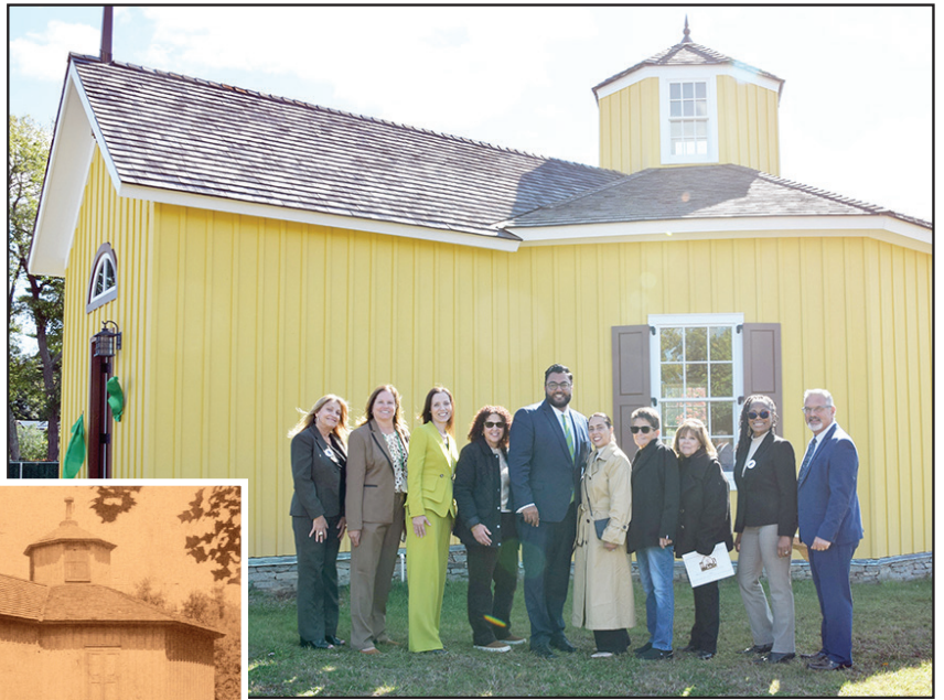
la Sociedad Histórica de Brentwood después de su constitución en 1992.

El edificio funcionó como escuela hasta 1907 y posteriormente como residencia privada. Fue donada al Distrito Escolar Gratuito Unificado de Brentwood por sus propietarios privados y trasladada a una propiedad del distrito cerca del edificio administrativo en 1989. Los esfuerzos de restauración comenzaron en la década de 1990, liderada por