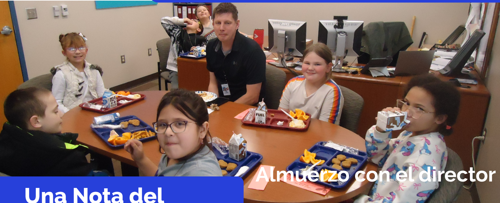
Almuerzo con el director