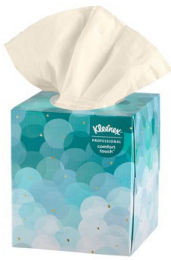
Pañuelos / Kleenex