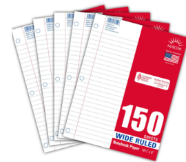
Papel de rayas anchas