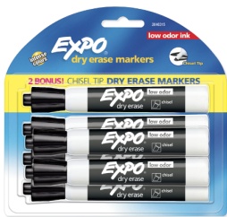
Marcadores Expo negros