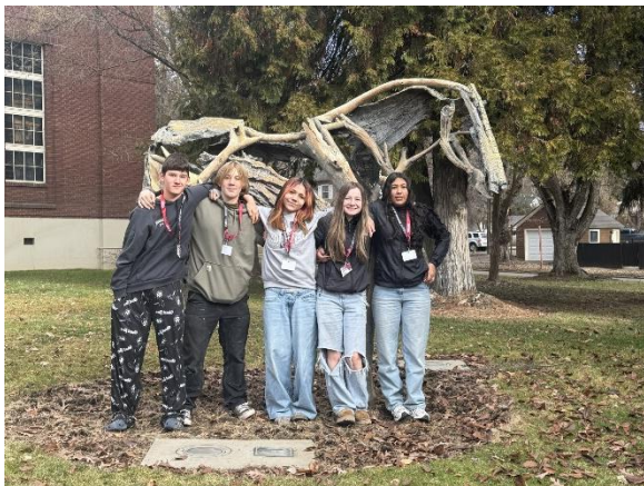
Universidad Central de Washington