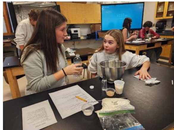
Chillowist y masa madre cruda