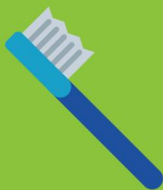
Limpieza de dientes