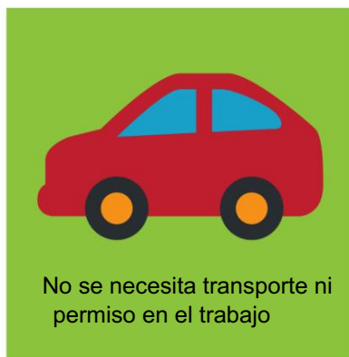
No se necesita transporte ni permiso en el trabajo

Los alumnos recibirán instrucciones para sus padres o tutores sobre el tratamiento adicional necesario o consejos para una buena salud bucal. ¿En ocasiones, se recomendará a los niños que a una de nuestras clínicas para recibir tratamiento adicional, el cual puede ser gratuito.