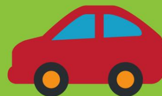
No se necesita transporte ni tiempo libre del trabajo