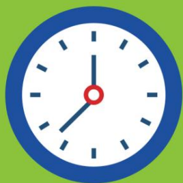
Visita de 30 a 45 minutos

La atención dental en la escuela está disponible para estudiantes con Forward Health, Badger Care o sin seguro dental que califiquen para almuerzo gratuito o reducido.