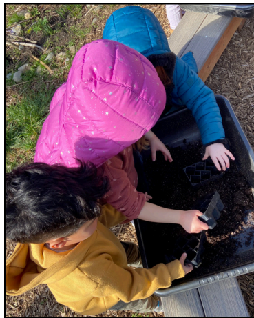
Foto: Estudiantes de jardín de infantes plantando guisantes en la granja escolar.