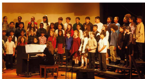
Los alumnos de 5.º a 8.º grado participaron en nuestro concierto anual de invierno, en el que participaron tanto los miembros de la banda como los del coro.