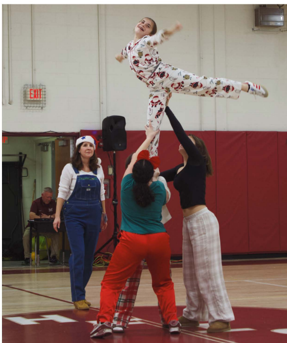
Los estudiantes y el personal participaron en múltiples eventos para fomentar una cultura positiva.