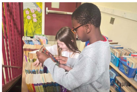
Los maestros de 3.º grado crearon una biblioteca comunitaria para que los estudiantes puedan acceder