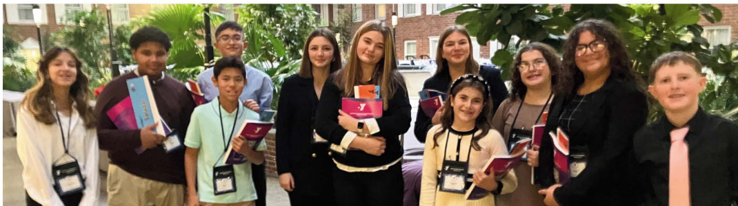
Los estudiantes participaron en las Competiciones de la Asamblea Estatal.