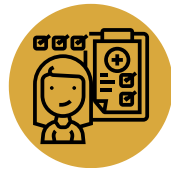
Health Examination (On or After February 13, 2026) (Strongly Recommended)