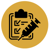
Immunization Record (Up to Date)

To complete the TK/K registration process, bring your student's immunization record, health, dental and TB clearance to your school of residence.