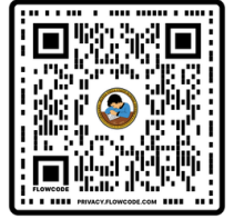
ਆਪਣਾ ਸਕੂਲ ਲੱਭੋ

P-BVUSD ਕੈਲੀਫੋਰਨੀਆ ਦੇ ਵਿਸਤ੍ਰਿਤ ਸਿਖਲਾਈ ਅਵਸਰ ਪ੍ਰੋਗਰਾਮ (Expanded Learning Opportunities Program, ELO-P) ਰਾਹੀਂ ਪਰਿਵਾਰਾਂ ਨੂੰ ਬਿਨਾਂ ਕਿਸੇ ਕੀਮਤ ਦੇ ਸਾਰੇ ਸਕੂਲ ਤੋਂ ਬਾਅਦ ਦੇ ਪ੍ਰੋਗਰਾਮਿੰਗ ਦੀ ਪੇਸ਼ਕਸ਼ ਕਰਦਾ ਹੈ। ਸਾਰੇ TK/K ਵਿਦਿਆਰਥੀਆਂ ਲਈ ELO-P ਰਜਿਸਟ੍ਰੇਸ਼ਨ TK-K ਦੇ ਸ਼ੁਰੂਆਤੀ ਦਾਖਲੇ ਅਤੇ ਸਕੂਲ ਪਲੇਸਮੈਂਟ ਤੋਂ ਬਾਅਦ ਖੁੱਲ੍ਹਦੀ ਹੈ। ਦਾਖਲੇ ਦੀ ਮਿਆਦ ਖੁੱਲ੍ਹਣ ਤੋਂ ਬਾਅਦ, ਇੱਕ ਇੰਟਰਸਟ ਫਾਰਮ ਡਿਸਟ੍ਰਿਕਟ ਵੈੱਬਸਾਈਟ 'ਤੇ ਉਪਲਬਧ ਹੋਵੇਗਾ। ਸੰਭਾਵਿਤ ਦਾਖਲੇ ਵਾਸਤੇ ਸੰਪਰਕ ਕੀਤੇ ਜਾਣ ਵਾਲੇ ਇੰਟਰਸਟ ਫਾਰਮ ਨੂੰ ਪੂਰਾ ਕਰੋ। ਵਧੇਰੇ ਜਾਣਕਾਰੀ , ਜਿਸ ਵਿੱਚ ਸਵੀਕਾਰ ਕੀਤੇ ਵਿਦਿਆਰਥੀ, ਉਡੀਕ ਸੂਚੀ ਅਤੇ ਪ੍ਰੋਗਰਾਮ ਦੇ ਵੇਰਵੇ ਸ਼ਾਮਲ ਹਨ ਜੁਲਾਈ ਦੇ ਅੱਧ ਵਿੱਚ ਪ੍ਰਦਾਨ ਕੀਤੀ ਜਾਵੇਗੀ । ਕਿਸੇ ਵੀ ਸਵਾਲਾਂ ਲਈ ਕਿਰਪਾ ਕਰਕੇ (661)831-8331 ਐਕਸਟੈਂਸ਼ਨ 6603 'ਤੇ ਕਾਲ ਕਰੋ।