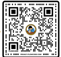
ELO-P ਦਿਲਚਸਪੀ ਫਾਰਮ

P-BVUSD ਕੈਲੀਫੋਰਨੀਆ ਦੇ ਵਿਸਤ੍ਰਿਤ ਸਿਖਲਾਈ ਅਵਸਰ ਪ੍ਰੋਗਰਾਮ (Expanded Learning Opportunities Program, ELO-P) ਰਾਹੀਂ ਪਰਿਵਾਰਾਂ ਨੂੰ ਬਿਨਾਂ ਕਿਸੇ ਕੀਮਤ ਦੇ ਸਾਰੇ ਸਕੂਲ ਤੋਂ ਬਾਅਦ ਦੇ ਪ੍ਰੋਗਰਾਮਿੰਗ ਦੀ ਪੇਸ਼ਕਸ਼ ਕਰਦਾ ਹੈ। ਸਾਰੇ TK/K ਵਿਦਿਆਰਥੀਆਂ ਲਈ ELO-P ਰਜਿਸਟ੍ਰੇਸ਼ਨ TK-K ਦੇ ਸ਼ੁਰੂਆਤੀ ਦਾਖਲੇ ਅਤੇ ਸਕੂਲ ਪਲੇਸਮੈਂਟ ਤੋਂ ਬਾਅਦ ਖੁੱਲ੍ਹਦੀ ਹੈ। ਦਾਖਲੇ ਦੀ ਮਿਆਦ ਖੁੱਲ੍ਹਣ ਤੋਂ ਬਾਅਦ, ਇੱਕ ਇੰਟਰਸਟ ਫਾਰਮ ਡਿਸਟ੍ਰਿਕਟ ਵੈੱਬਸਾਈਟ 'ਤੇ ਉਪਲਬਧ ਹੋਵੇਗਾ। ਸੰਭਾਵਿਤ ਦਾਖਲੇ ਵਾਸਤੇ ਸੰਪਰਕ ਕੀਤੇ ਜਾਣ ਵਾਲੇ ਇੰਟਰਸਟ ਫਾਰਮ ਨੂੰ ਪੂਰਾ ਕਰੋ। ਵਧੇਰੇ ਜਾਣਕਾਰੀ , ਜਿਸ ਵਿੱਚ ਸਵੀਕਾਰ ਕੀਤੇ ਵਿਦਿਆਰਥੀ, ਉਡੀਕ ਸੂਚੀ ਅਤੇ ਪ੍ਰੋਗਰਾਮ ਦੇ ਵੇਰਵੇ ਸ਼ਾਮਲ ਹਨ ਜੁਲਾਈ ਦੇ ਅੱਧ ਵਿੱਚ ਪ੍ਰਦਾਨ ਕੀਤੀ ਜਾਵੇਗੀ । ਕਿਸੇ ਵੀ ਸਵਾਲਾਂ ਲਈ ਕਿਰਪਾ ਕਰਕੇ (661)831-8331 ਐਕਸਟੈਂਸ਼ਨ 6603 'ਤੇ ਕਾਲ ਕਰੋ।