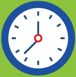
Visita de 30 a 45 minutos

Los estudiantes con seguro dental Forward Health, Badger Care o sin seguro dental que califiquen para almuerzo gratuito o a precio reducido tienen acceso a atención dental dentro de la escuela.