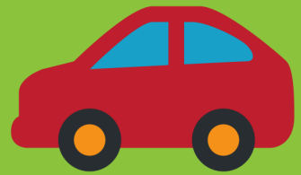
No se necesita transporte ni permiso en el trabajo

¿Cómo es una visita a un centro escolar?