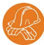
ਬਿਲਡਿੰਗ ਐਂਡ ਕੰਸਟਰਕਸ਼ਨ ਟਰੇਡਿਜ਼