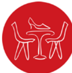
ਫੈਸ਼ਨ ਐਂਡ ਇੰਟੀਰੀਅਰ ਡਿਜ਼ਾਈਨ