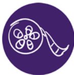
ਆਰਟਸ, ਮੀਡੀਆ, ਐਂਟਰਟੇਨਮੈਂਟ