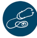
ਹੈਲਥ ਸਾਇੰਸ ਐਂਡ ਮੈਡੀਕਲ ਟੈਕਨੋਲੋਜੀ