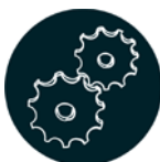
ਮੈਨੁਫੈਕਚਰਿੰਗ ਐਂਡ ਪ੍ਰੋਡਕਟ ਡੈਵਲਪਮੈਂਟ