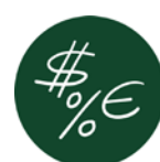
ਬਿਜਨੇਸ ਐਂਡ ਫਾਇਨੈਂਸ