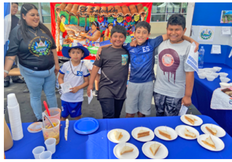
Families proudly share their heritage at the annual International Festival.

Juntos, nuestra comunidad escolar está comprometida a apoyar a todos los estudiantes en el desarrollo de las habilidades que necesitan para ser pensadores críticos y colaborativos, entusiasmados por ampliar sus conocimientos a través de experiencias de aprendizaje cuidadosamente planificadas. Si desea unirse a nuestra comunidad, lo invitamos a comunicarse con nuestra oficina para programar una visita. 408-523-4870.