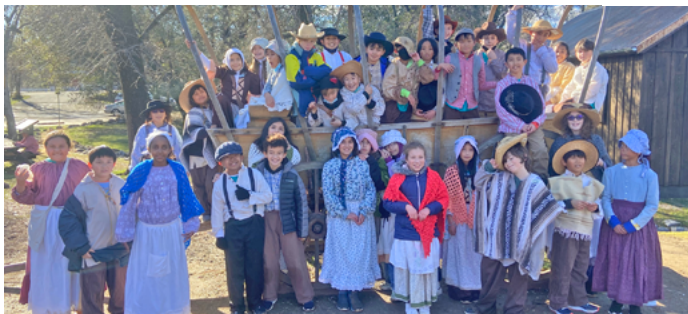
Fourth graders learn about the gold rush during an overnight field trip to Columbia State Park.