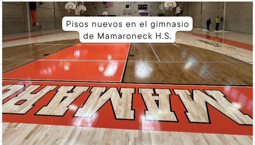
Pisos nuevos en el gimnasio de Mamaroneck H.S.