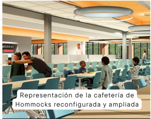
Representación de la cafetería de Hommocks reconfigurada y ampliada