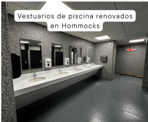
Vestuarios de piscina renovados en Hommocks