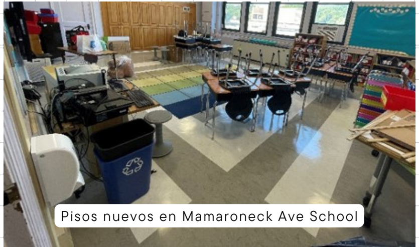
Pisos nuevos en Mamaroneck Ave School