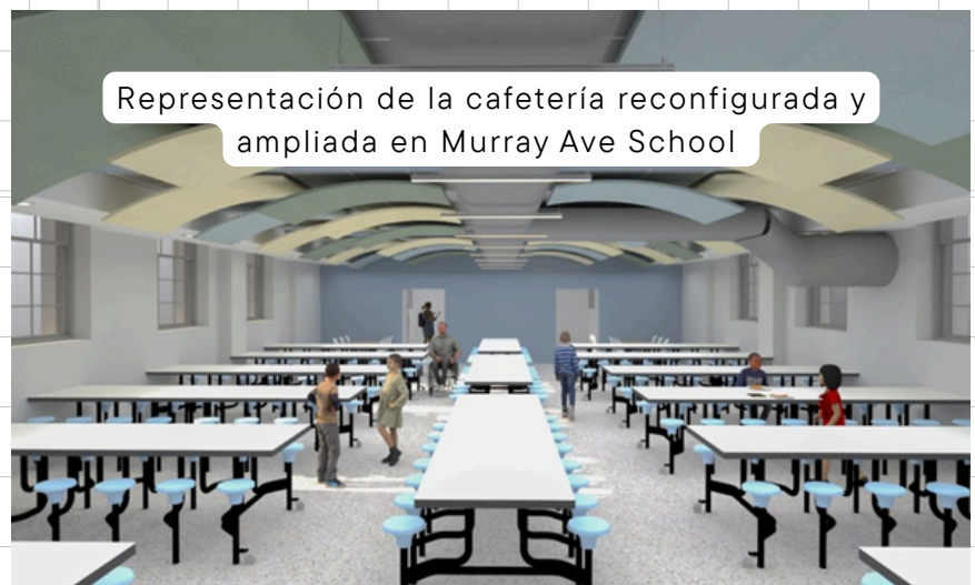
Representación de la cafetería reconfigurada y ampliada en Murray Ave School