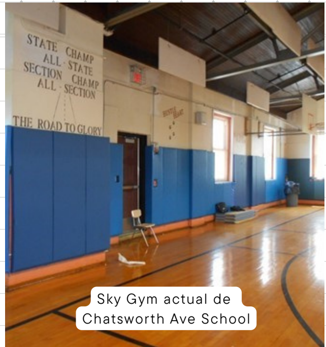
Sky Gym actual de Chatsworth Ave School