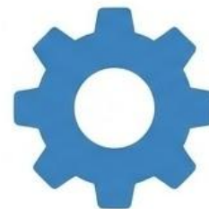
Mantenimiento o Reparación