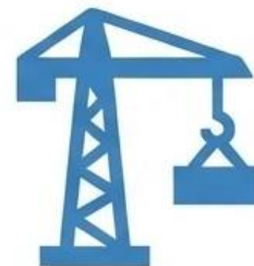
Construcción y Mejoras