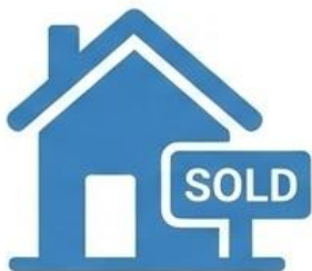
Terreno y Otros Activos

Para construcción de infraestructura y mejoras con una vida útil de 1 año o más.