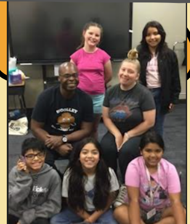
Administrador y el Club