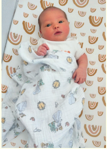
Lyvvi Kirby Mini Mamuts