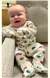
Thomas Woods Mini Mamuts

Estos Mini Mamuts se unieron a nuestra escuela durante el año escolar 2023-2024.