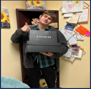
UHY Student Shoe Donation