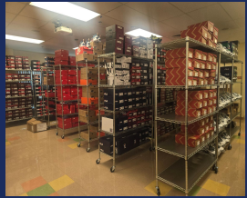
MVP Sneaker Closet