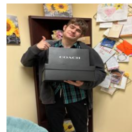
Estudiante UHY Donación de zapatos