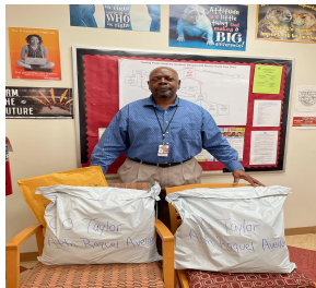
Delivery of Essential Supplies