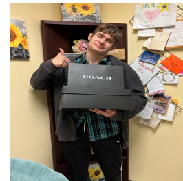
UHY Student Shoe Donation