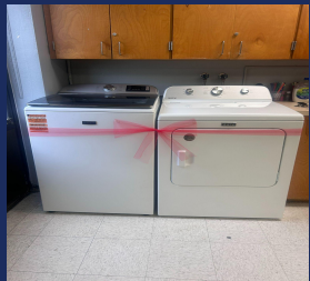
Degy Entertainment Palm Beach Lakes HS