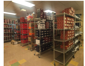
MVP Sneaker Closet