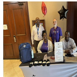
Outreach Community Event