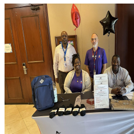
Evento Comunitario de Participación