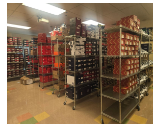
Clóset para Tenis MVP