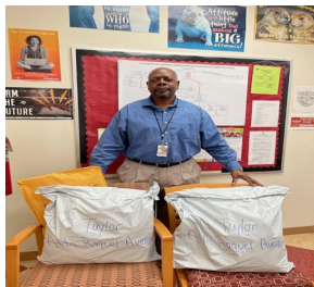
Delivery of Essential Supplies