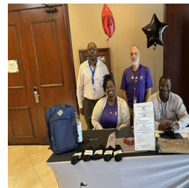
Outreach Community Event