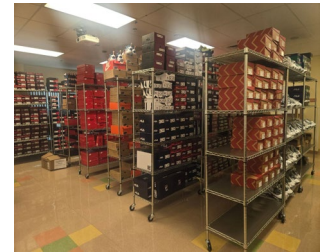
MVP Sneaker Closet