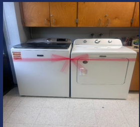
Degy Entertainment Palm Beach Lakes HS