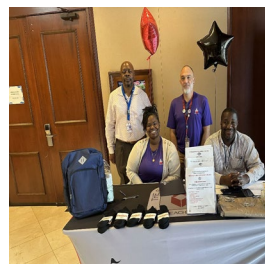
Evento Comunitario de Participación