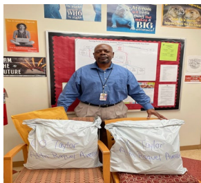
Entrega de Materiales Esenciales