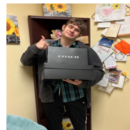
Estudiante UHY Donación de zapatos