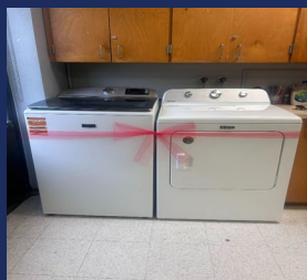
Degy Entertainment Palm Beach Lakes HS