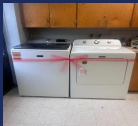
Degy Entertainment Palm Beach Lakes HS