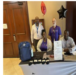
Outreach Community Event