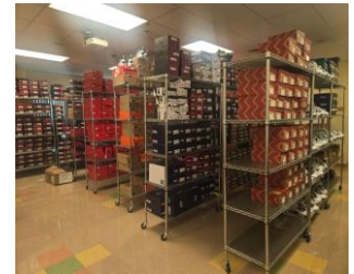
MVP Sneaker Closet