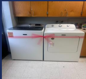
Degy Entertainment Palm Beach Lakes HS