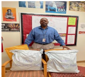
Delivery of Essential Supplies