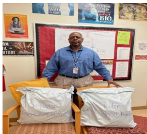
Entrega de Materiales Esenciales