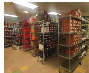
Closet para Tenis MVP