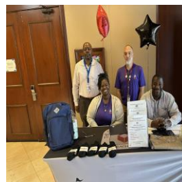
Evento Comunitario de Participación