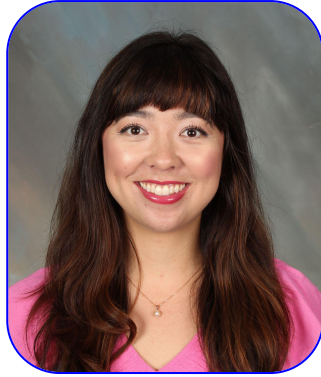
Kami Kurisu Cru-Hern