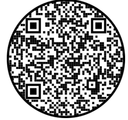
Escanea para visitar la tienda MemberHub

Completar la(s) sección(es) apropiada(s) a continuación con efectivo o cheque.