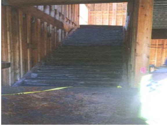
1er piso de edificio D en Parkway Heights– enero 2015

Revise el sitio web para el día y horario: http://www.ssfusd.org/mjb