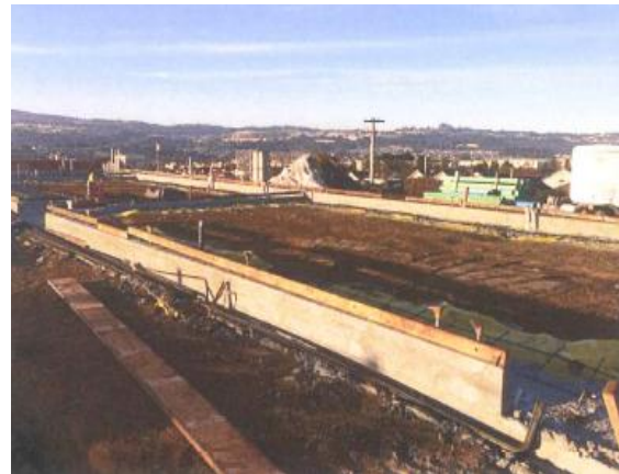
Fundamento de West Campus en Parkway – enero 2015

Continúa la construcción de la escuela Intermedia Parkway Heights. El proyecto Parkway es muy complejo. No sólo nueva construcción tendrá lugar, sino también una renovación de los edificios de vestuario. Al principio, aulas temporales se instalaron para los estudiantes hasta que los nuevos edificios fueron completados. Así que hay mucha actividad en el campus. El primer edificio programado para completarse es el primer 12 PK de SSFUSD. Doce 960 SF nuevas aulas con muebles nuevos serán los primeros de 33 en Parkway. Habrá otro 12 PK edificio de aulas a Parkway, y uno se está construyendo en SSFHS también.