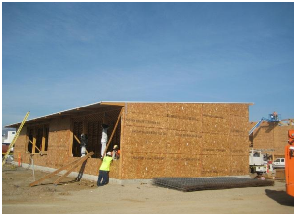
SSFHS Edificio de Aulas 2 PK – enero 2015

Como saben todos en South San Francisco, tuvimos algunos fenómenos meteorológicos muy severo el mes pasado; tan severa que la Junta de Síndicos unánimemente cerraron las escuelas del distrito durante dos días para garantizar la seguridad de sus alumnos y personal y para minimizar la preocupación de nuestras familias. El Departamento de Facilidades estaba en lista de espera para mitigar las consecuencias graves resultantes de estas tormentas. El equipo de Bono estaba en mano para supervisar los daños de los proyectos del bono podrían haber sostenido. Nos complace informarle de que ningún daño significativo ocurrió.