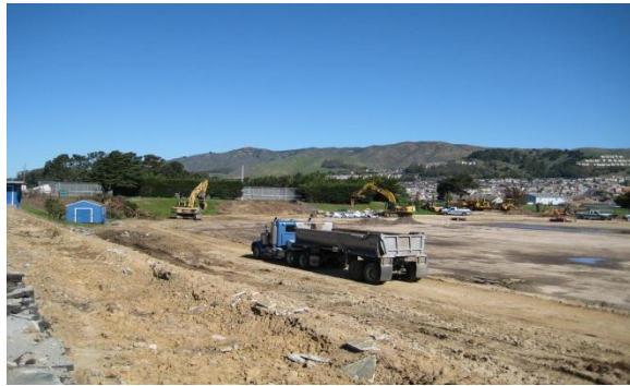
SSFHS campo de atletismo – marzo 2014

Para noticias actuales mire al sitio Web: http://ssfusd.bond.swinerton.com/