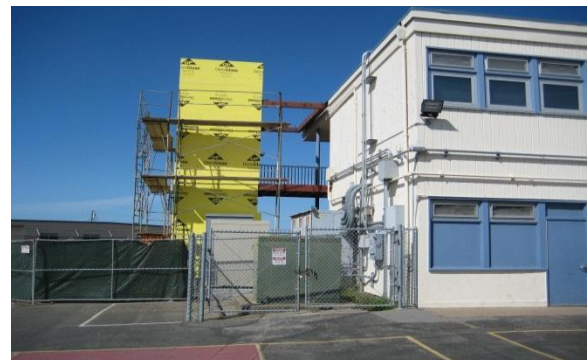
Spruce ES Nueva Torre de Elevador – marzo 2014

Proyectos de verano 2014 están calentando. Cajas de mudanza y otras actividades de construcción son inminente en Spruce, Ponderosa y Westborough. Estas escuelas constituyen trabajo fase dos modulares. Al final del verano, se unirán a los otros campos escolares con nuevos entornos de aprendizaje state-of-the-art.