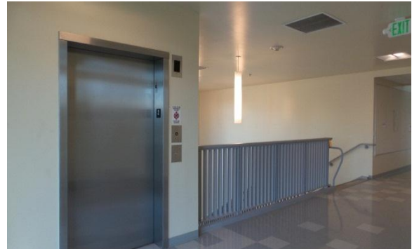
Parkway Edificio D – febrero 2016

Parkway abrió cuatro nuevos edificios en enero. Edificio D, un edificio de 12 aulas, y el edificio G, un edificio de asesoramiento, se abrió el 1 de febrero, junto con los edificios del Campus Oeste - Edificio I y J. Los estudiantes se trasladaron de las aulas temporales a las nuevas construcciones. Entonces los estudiantes muy pronto se trasladarán a las aulas existentes a aulas temporales con el fin de comenzar la demolición de esos edificios. En esta transición, los nuevos planes de ajuste de fase pueden ser creadas para facilitar una mejor relación de construcción y operación de la escuela.