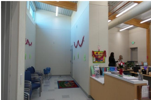
Buri Buri la oficina de administración – febrero 2016

El 21 de enero de 2016, la Junta de Síndicos SSFUSD convocó a una reunión especial para abordar las preocupaciones en curso el Distrito ha tenido con el programa J Medida de Bono y su contratista principal, USS Cal Constructores. Después de revisar una historia de la obra de bonos, ya la luz de los hallazgos de la auditoría lanzado en la primavera pasada, la Junta decidió seguir discontinuar su relación con USS Cal Constructores. El personal está en el proceso de revisión de cómo se llevará a cabo esta transición. se tomará la atención todo lo posible para agilizar estos cambios.