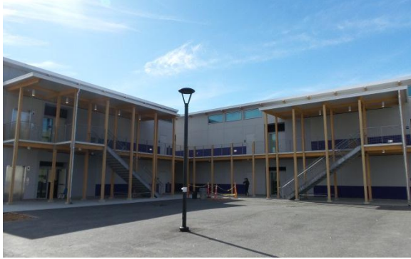
Parkway Heights Campus Oeste – febrero 2016