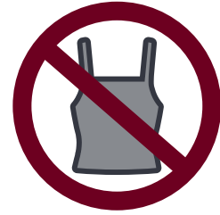
NO SE PERMITE LA ROPA REVELADORA