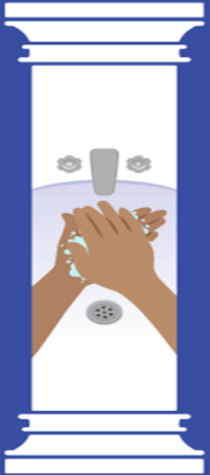
Health & Hygiene