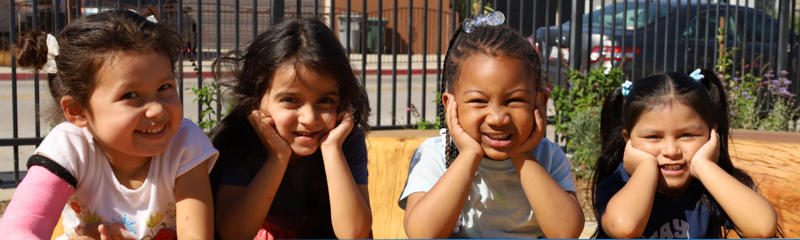
Students enjoy a new outdoor learning space at Lindbergh Elementary, which is one of 10 Lynwood Unified schools set to have eco-friendly hubs with outdoor learning spaces to be completed by 2028.