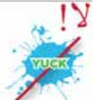
لا طعام أو مواد يفرغ جمع أفرغ المخلفات