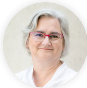
AGNÈS DE CRÉCY