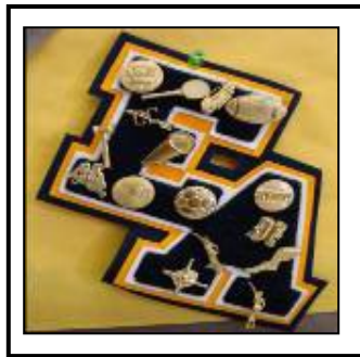
Arriba: EAHS Letra de Imprenta

Se pueden solicitar letras de imprenta para los atletas que completan una temporada en un equipo varsity. También se puede solicitar un prendedor para indicar el logro en esta área cada año después de que se gana letra (block). Si ha obtenido un bloque en atletismo, consulte al Director Atlético para solicitar su bloque. Las letras bloque pueden ser solicitadas para algunos programas y logros académicos.