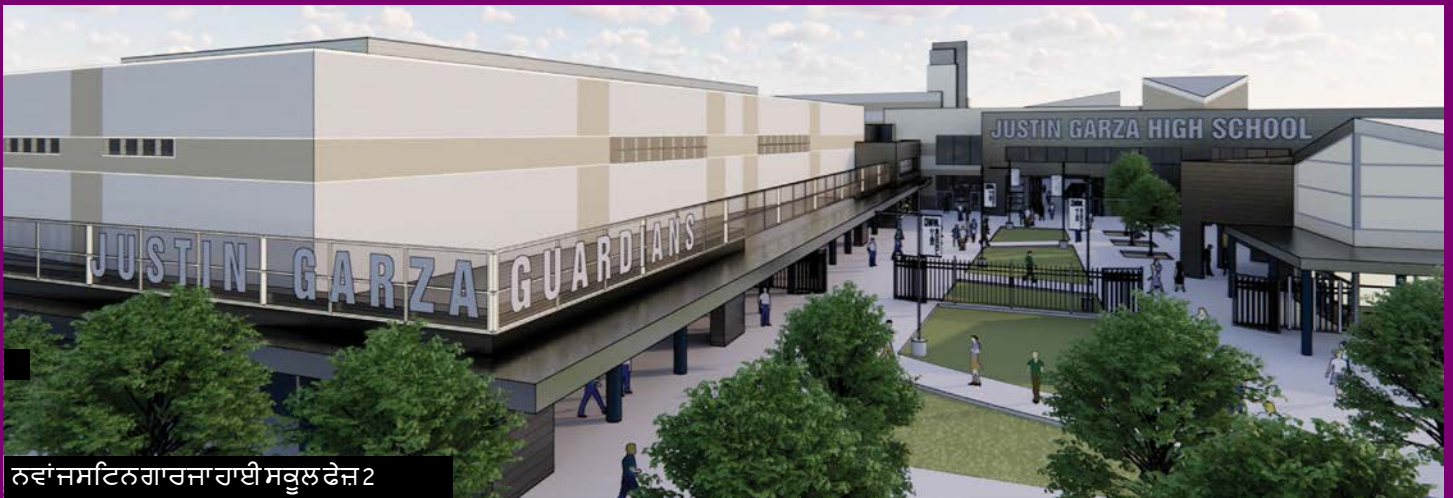
ਨਵਾਂ ਜਸਟਿਨ ਗਾਰਜਾ ਹਾਈ ਸਕੂਲ ਫੇਜ਼ 2