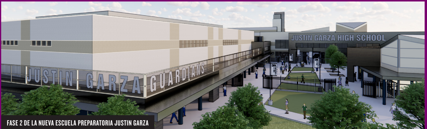
FASE 2 DE LA NUEVA ESCUELA PREPARATORIA JUSTIN GARZA

LAS BOLETAS DE VOTACIÓN POR CORREO DEBEN LLEVAR EL MATASELLOS POSTAL FECHADO PARA EL 3 DE NOVIEMBRE DE 2020