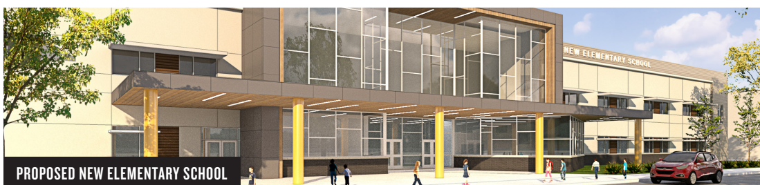
PROPOSED NEW ELEMENTARY SCHOOL

Measure D's estimated annual tax rate is less than 6¢ per $100 of assessed valuation