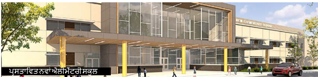
ਪੁਸਤਾ ਵਿੱਚ ਨਵਾਂ ਐਲੀਮੈਂਟਰੀ ਸਕੂਲ

ਮਿਯਰ ਡੀ.ਸੀ.ਸਾਲਾਨਾ ਟੈਕਸ ਦਰ ਮੁਲਾਂਕਣ ਕੀਤੇ ਗਏ ਮੁੱਲ ਅਨੁਸਾਰ ਪ੍ਰਤੀ 100 ਡਾਲਰ ਦੇ 6¢ ਤੋਂ ਘੱਟ ਹੈ