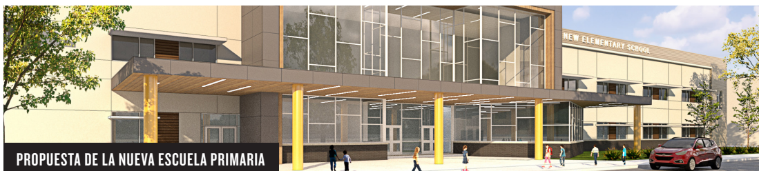
PROPUESTA DE LA NUEVA ESCUELA PRIMARIA

La tasa de impuestos anual de la Medida D es menos de 6¢ por cada $100 de tasación oficial