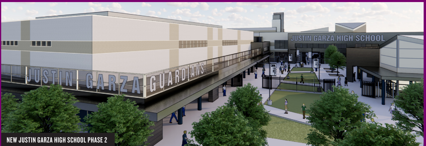
NEW JUSTIN GARZA HIGH SCHOOL PHASE 2

VOTE-BY-MAIL BALLOTS MUST BE POSTMARKED BY NOV. 3, 2020