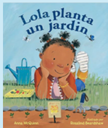
Lola planta un jardín Anna McQuinn

¡Aprenda más sobre el Día de la Tierra! ¡Haga clic en estas lecturas en voz alta!