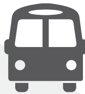
Transporte según elegibilidad