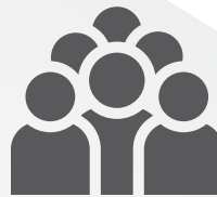
Excursiones según elegibilidad