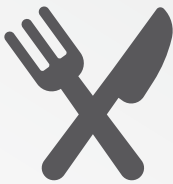
Desayuno y Almuerzo