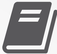
Honorarios de Clases según elegibilidad