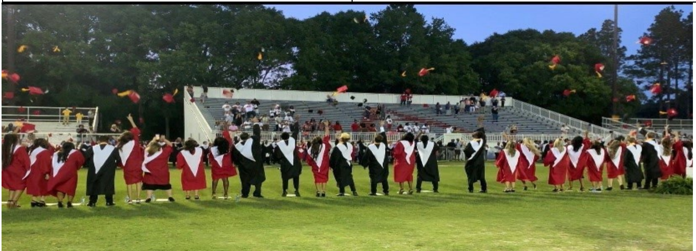
Escuela Secundaria del Condado de Appling