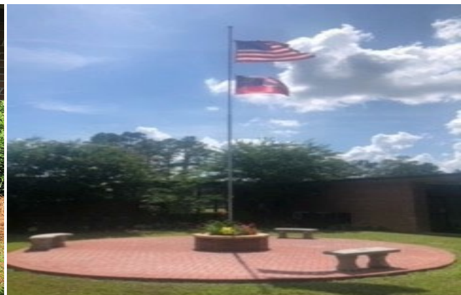
Escuela Primaria de Fourth District