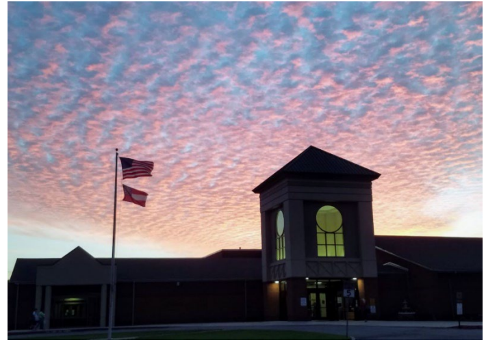
Escuela Intermedia del Condado de Appling Middle School