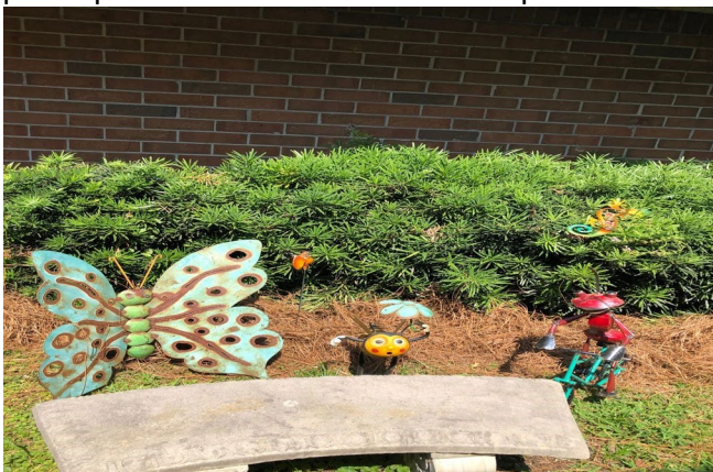
Escuela Primaria del Condado de Appling

Este año, la FEC proporcionará asistencia técnica y apoyo a todas las escuelas del Título I para garantizar que se cumplan con los requisitos de participación familiar y que se implementen estrategias y actividades de participación familiar. Las escuelas del Título I recibirán notificaciones y recursos del distrito y de la FEC para ayudarlas a mejorar y fortalecer la participación de la familia. Además de la comunicación frecuente y las visitas escolares, la FEC celebra reuniones trimestrales y capacitaciones con los FEC de sus escuelas de Título I para revisar los planes y actividades de participación familiar. Después, la FECR escolar capacitará a los administradores y al personal para mejorar y fortalecer la participación de la familia en sus respectivas escuelas.