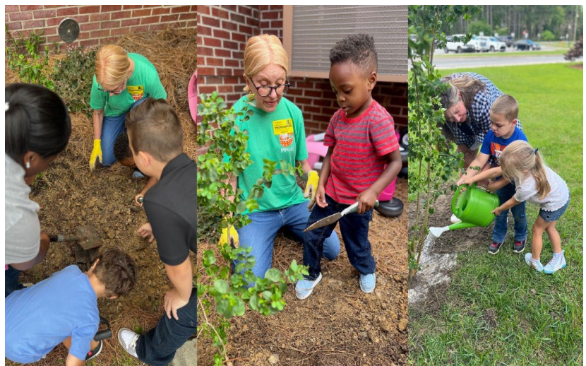
Escuela Primaria Altamaha