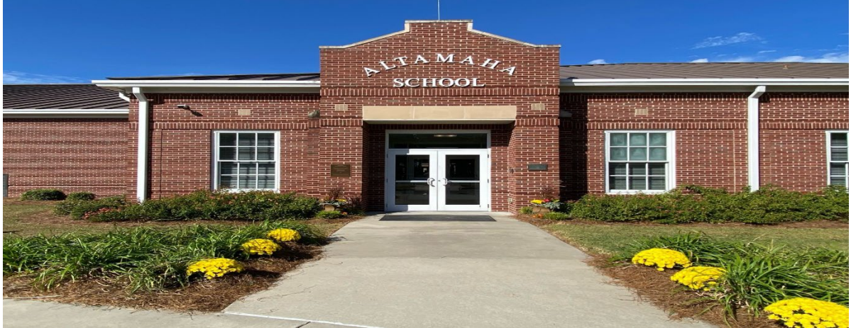
Escuela Primaria Altamaha