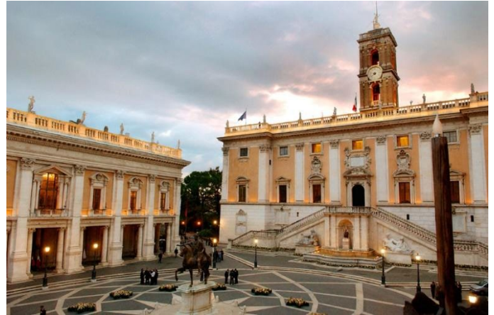
Author unknown (2010). Il Campidoglio. Guida Roma. Retrieved: 06-18-19 from: http://www.guidaroma.info/2010/11/25/290/

Nell'800 alcune sculture trovano posto in un padiglione a pianta ottagonale, la "Sala Ottagona", appositamente costruito nel giardino interno al primo piano del Palazzo dei Conservatori. Anche in questo periodo hanno luogo cospicue donazioni, dovute alla munificenza di collezionisti privati, tra le quali vanno ricordate la Collezione Castellani di vasi antichi e la Collezione Cini di porcellane. Il Medagliere Capitolino è costituito negli stessi anni, con l'acquisizione di importanti collezioni private di monete antiche e con i reperti numismatici provenienti dagli scavi urbani.