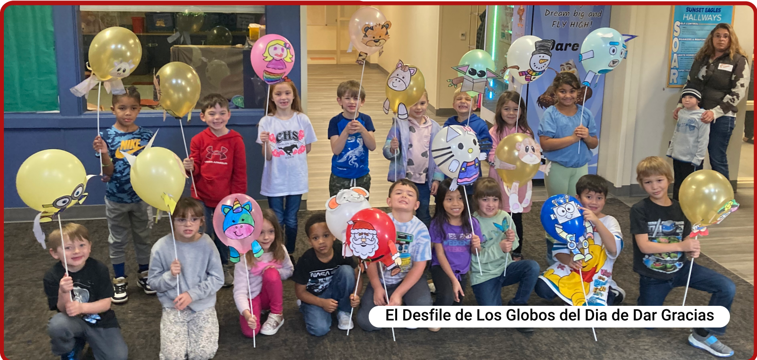
El Desfile de Los Globos del Dia de Dar Gracias