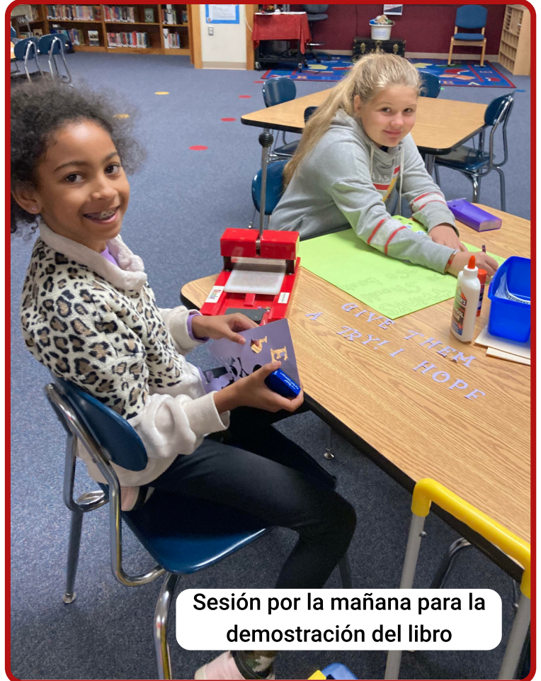
Sesión por la mañana para la demostración del libro

Si su niño come el desayuno en la cafetería, ustedes son bienvenidos para que los acompañen.