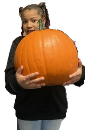
La familia Debbins-Williams