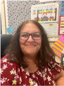
Sra. Kelly Rises

como siempre Ys, si tiene alguna pregunta o inquietud, no dude en comunicarse con nosotros.